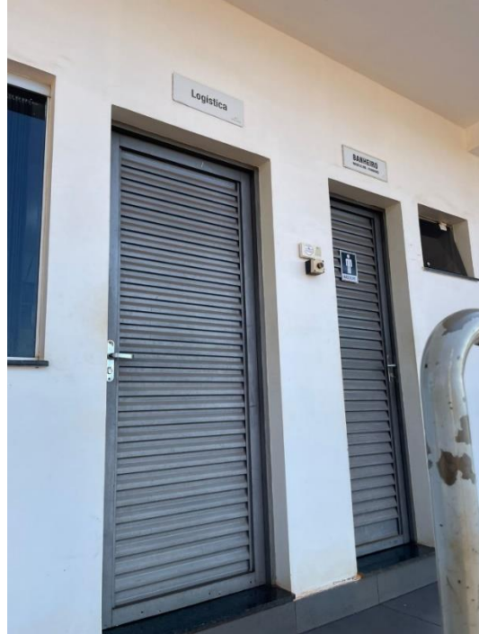
Imagem 26 – Sanitários da área comercial