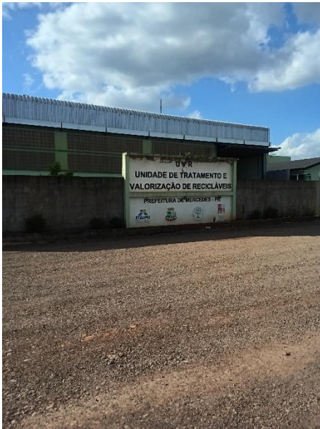
Imagem 12 – Unidade de Valorização de Recicláveis