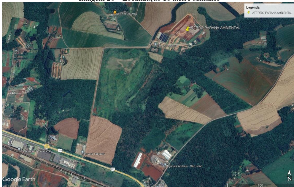
Imagem 20 – Localização do aterro sanitário