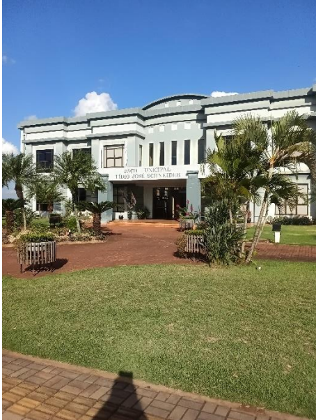
Imagem 1 – Prefeitura de Mercedes – PR