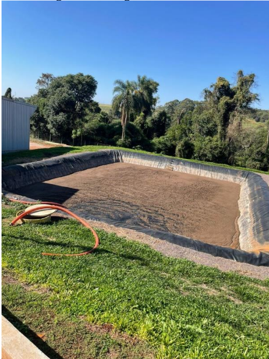
Imagem 30 – Lagoa de tratamento 01