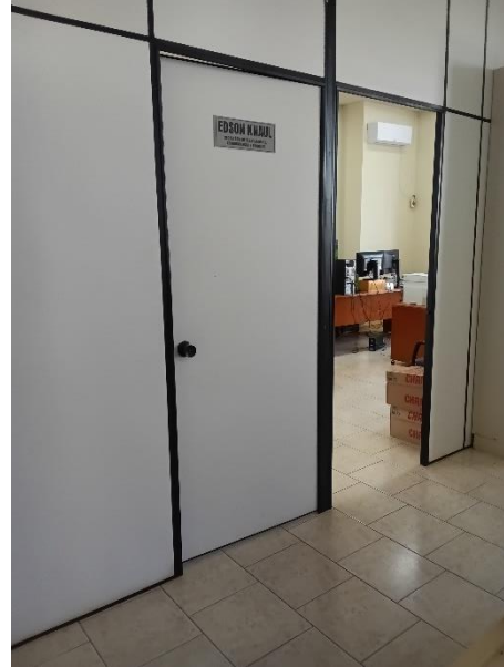
Imagem 2 – Placas de identificação nos ambientes