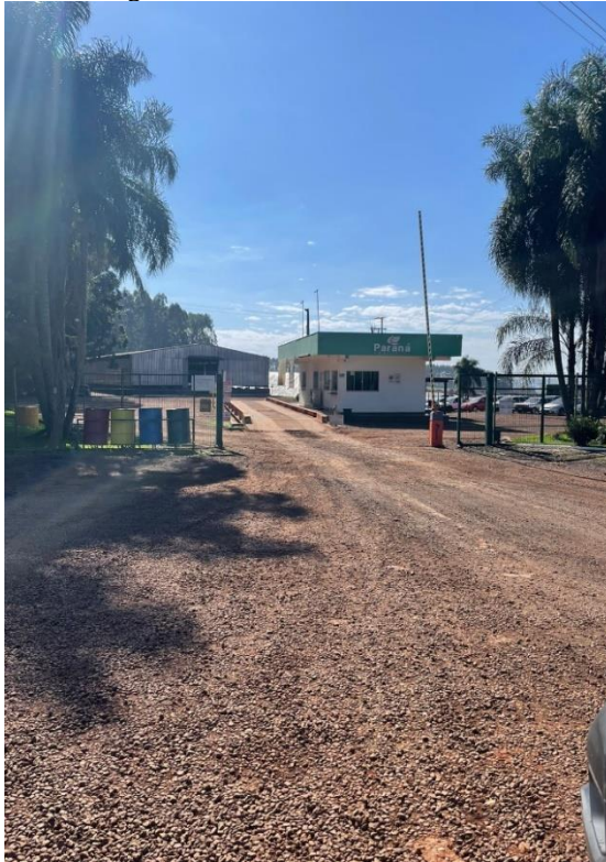
Imagem 21 – Entrada aterro sanitário