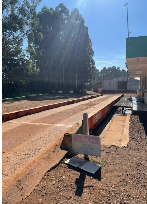
Imagem 22 – Balança