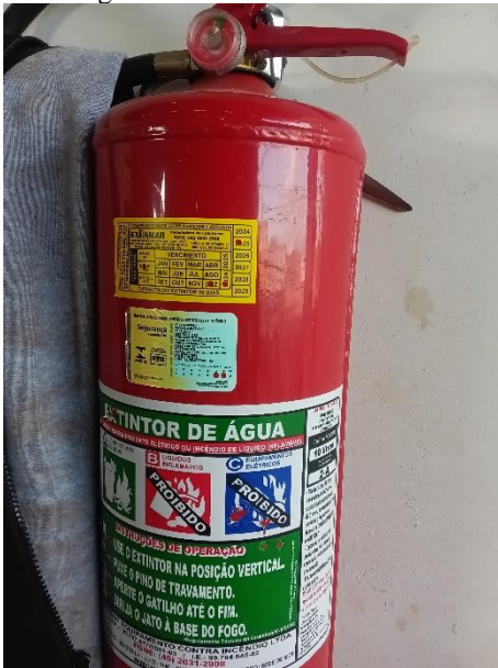
Imagem 14 – Extintor de incêndio