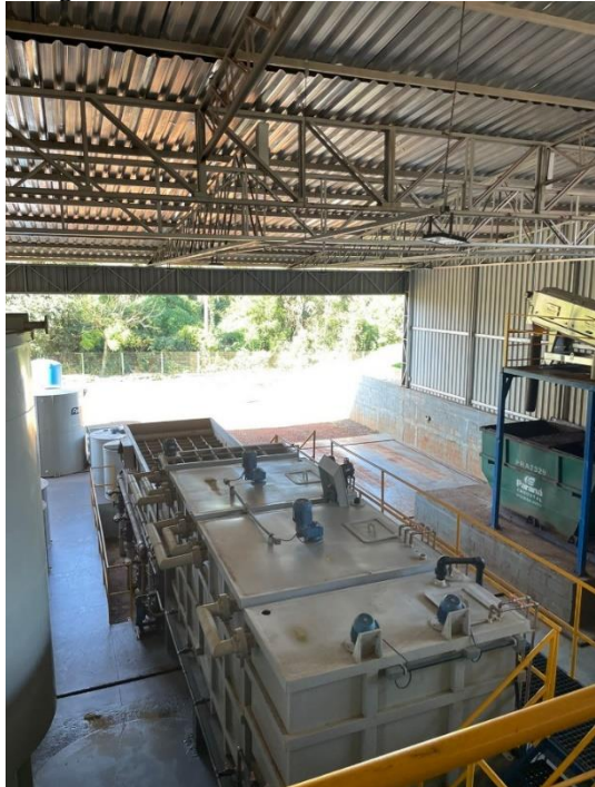
Imagem 32 – Sistema de tratamento do chorume