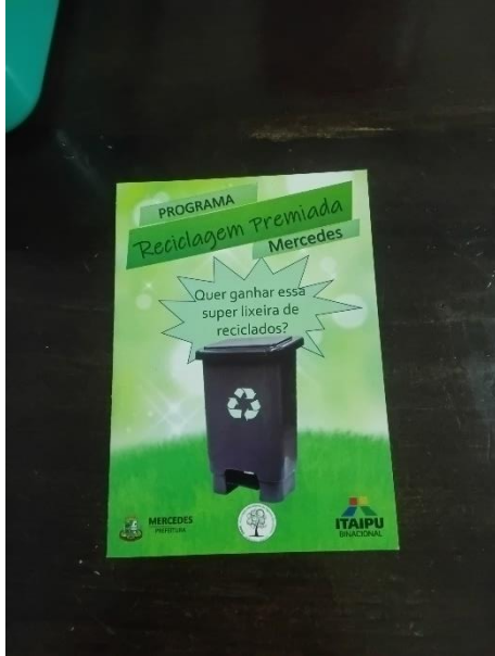
Imagem 36 - Frente de folder de campanha