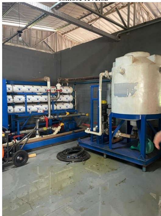
Imagem 33 – Tratamento de chorume utilizando osmose reversa