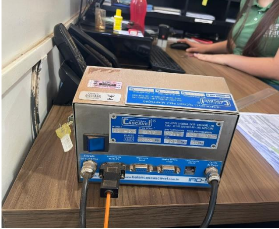
Imagem 25 – Identificação balança (parte lateral)