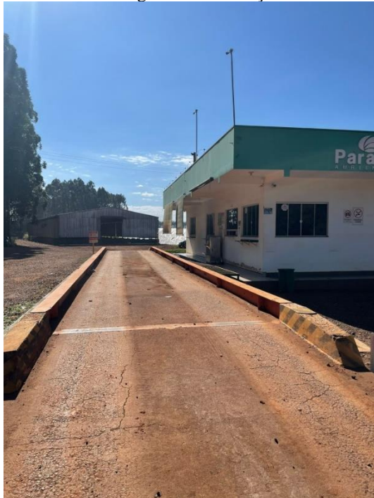
Imagem 23 – Balança