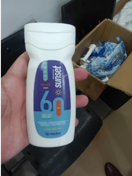
Imagem 9 – Protetor solar