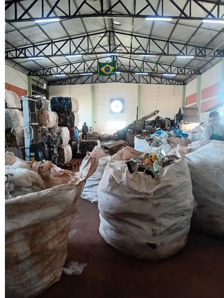
Imagem 13 – Barracão de UVR