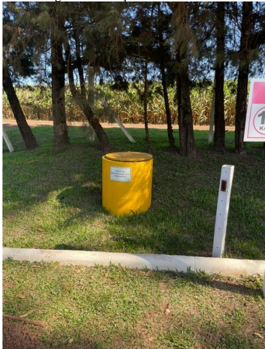
Imagem 34 – Poço de monitoramento