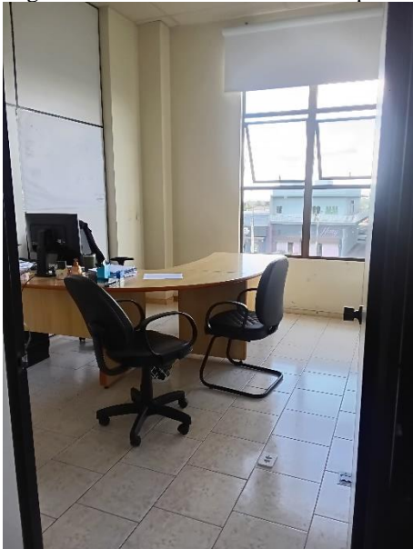
Imagem 3 – Local de atendimento ao público