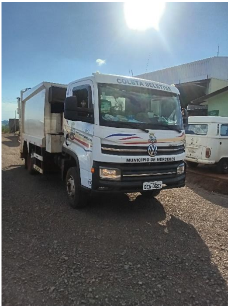
Imagem 7 – Frente e lateral caminhão de coleta de seletiva