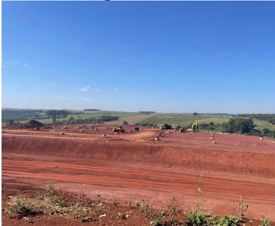
Imagem 27 – Valas